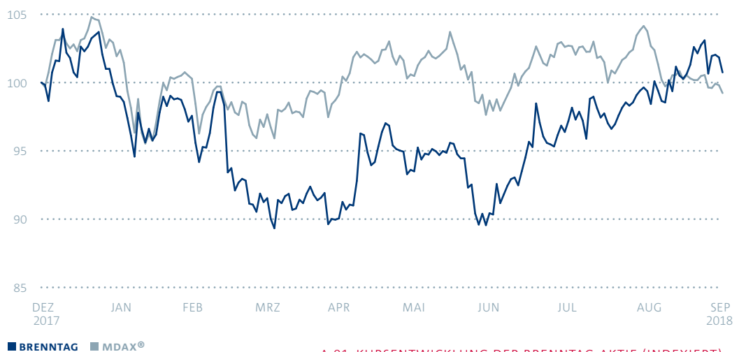
A.01 KURSENTWICKLUNG DER BRENNTAG-AKTIE (INDEXIERT)

Gemäß der Rangliste der Deutschen Börse AG belegte die Brenntag AG Ende September 2018 in Bezug auf die Marktkapitalisierung den 36. Platz aller gelisteten Unternehmen in Deutschland. Durchschnittlich wurden in den ersten neun Monaten des Jahres 2018 täglich rund 279.000 Brenntag-Aktien über Xetra® gehandelt.